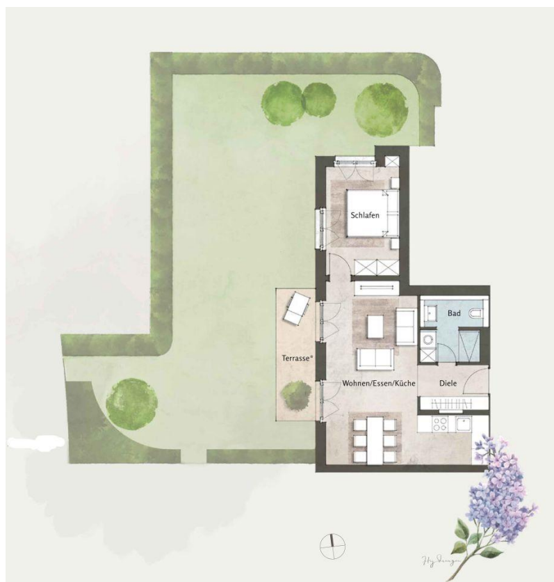
Beispielgrundriss Haus 1, WE 4