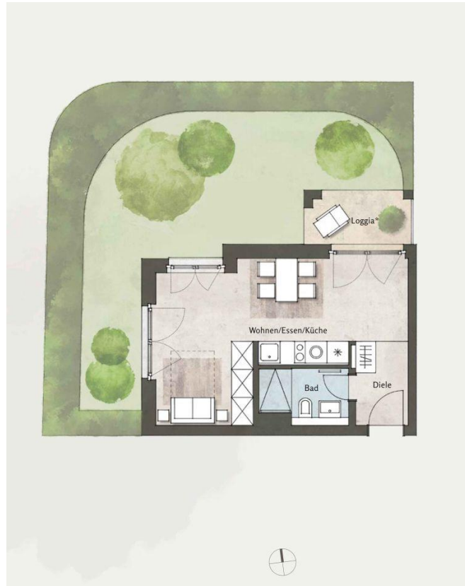
Beispielgrundriss Haus 5, WE 59