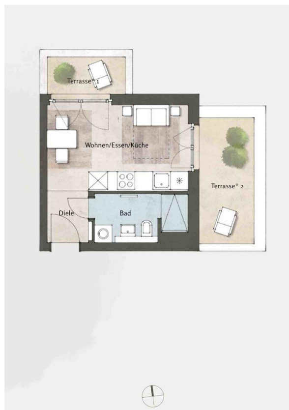
Beispielgrundriss Haus 5, WE 79, 1 Zi.