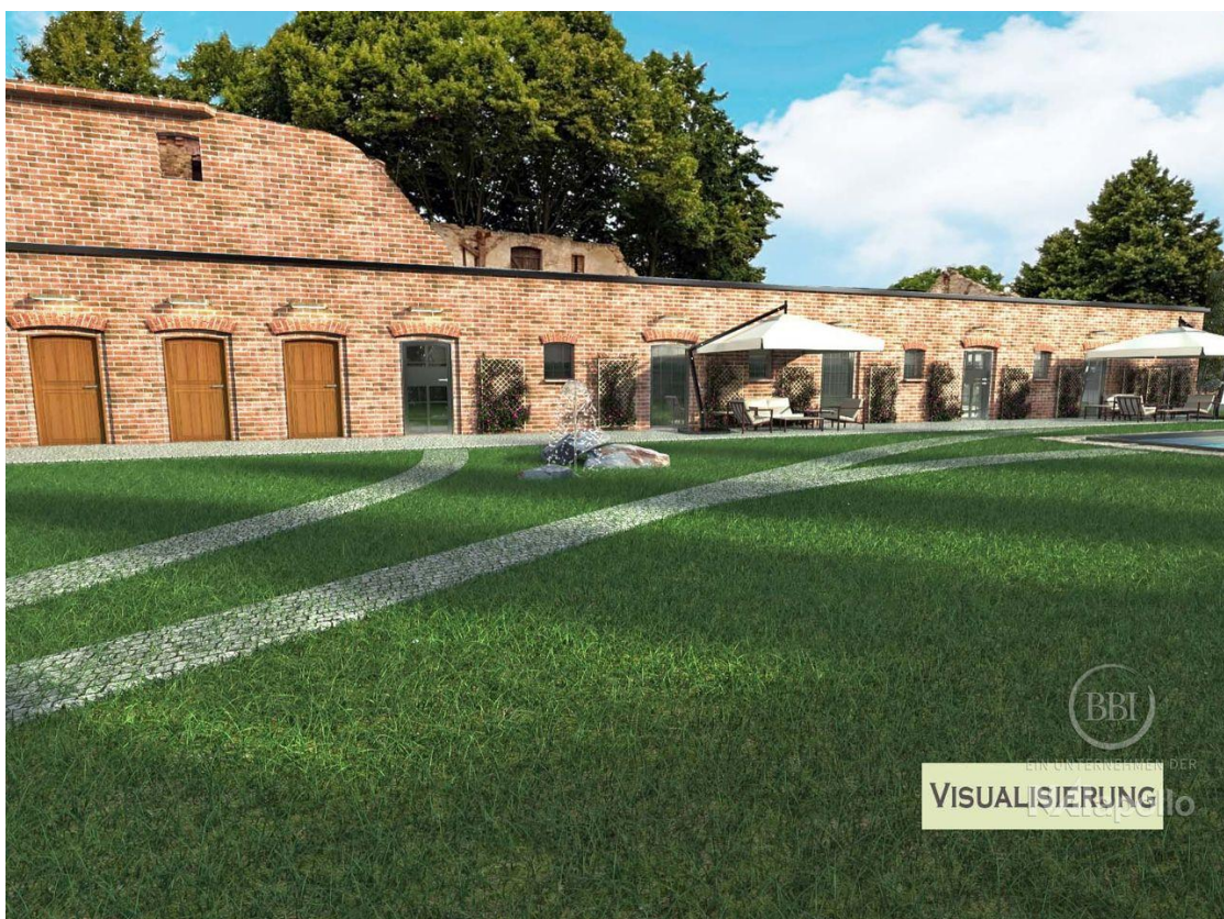
Visualisierung ohne Aufbau (2)_