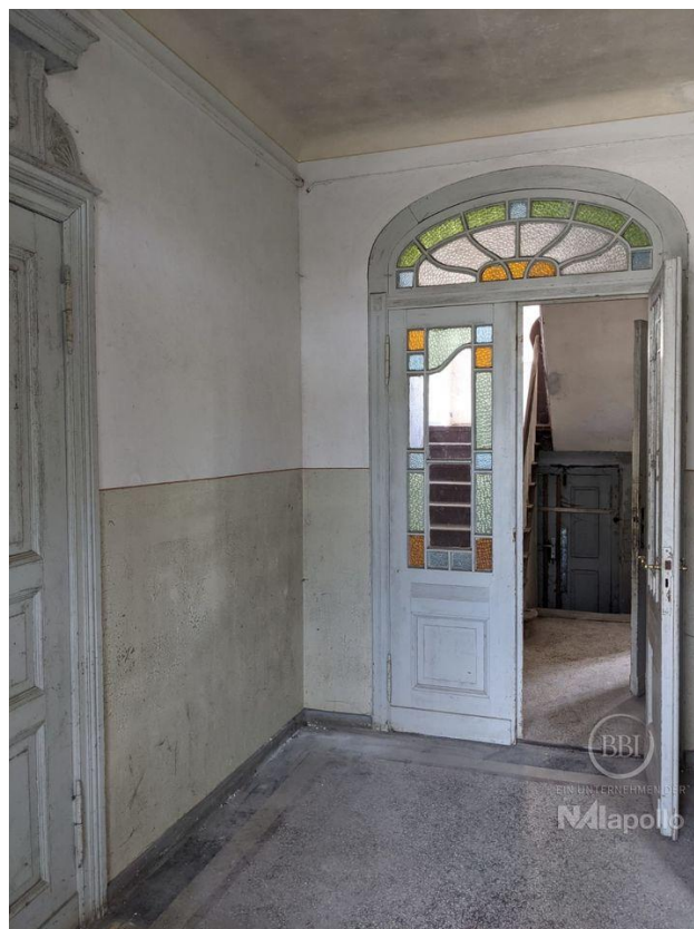
innen - vor Sanierung (5)