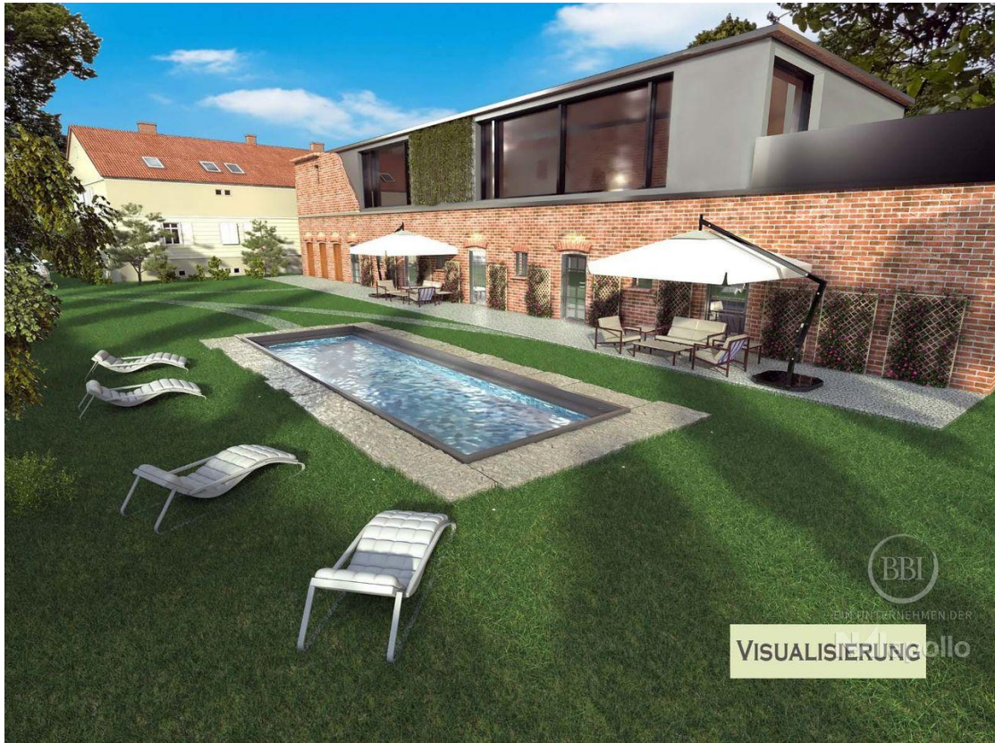
Visualisierung mit Aufbau(1)_