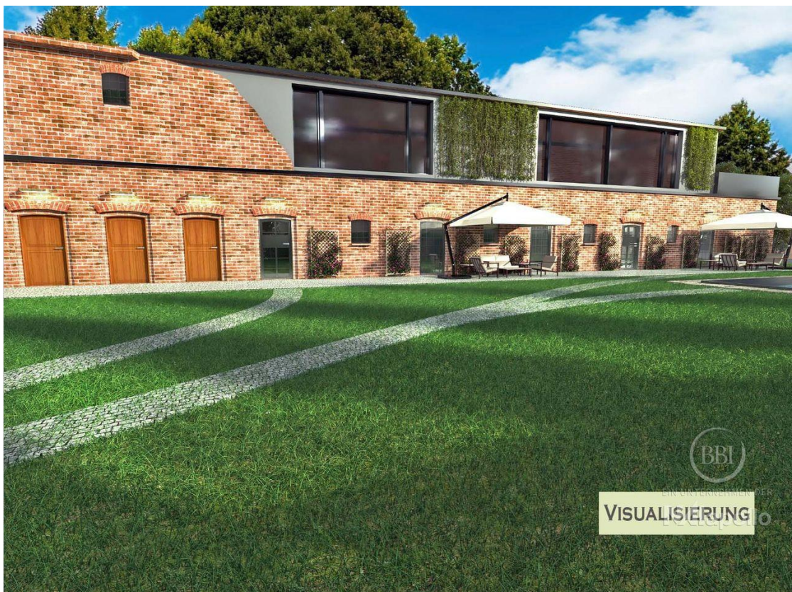
Visualisierung (7) mit Aufbau