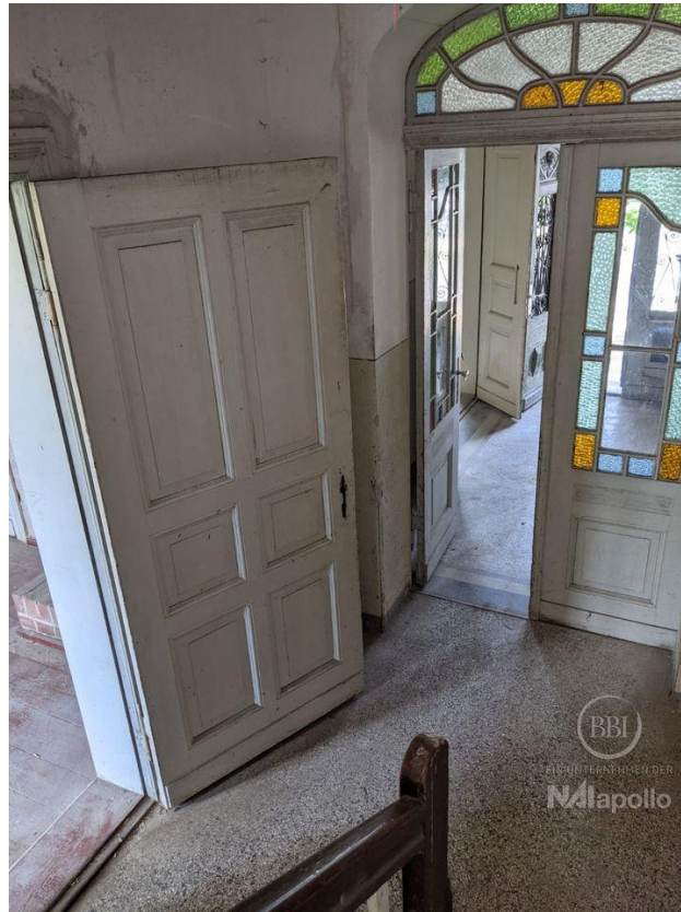
innen - vor Sanierung (6)