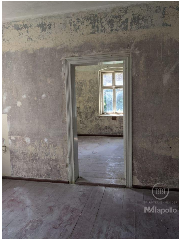
innen - vor Sanierung (4)