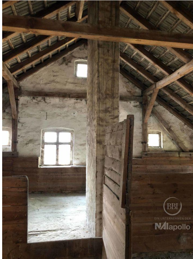
akt Bautenstand (4)