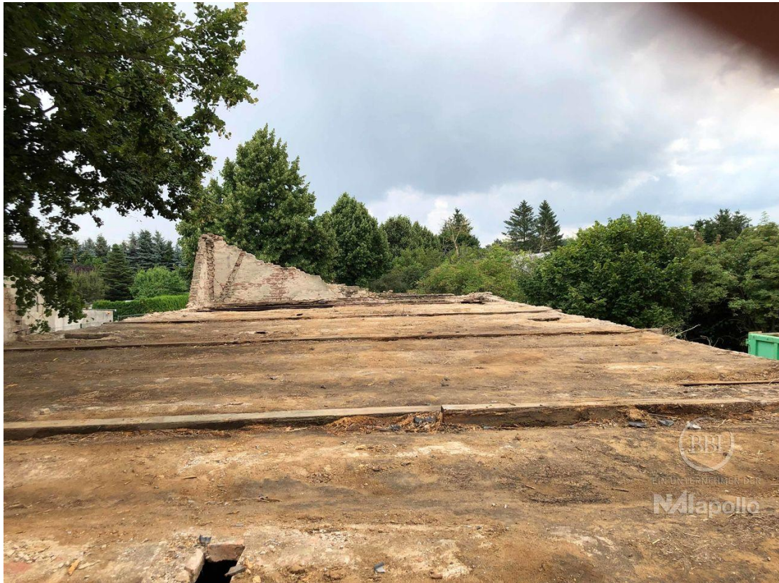
akt Bautenstand (11)