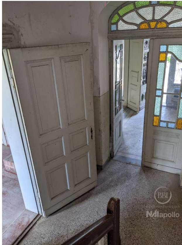
innen - vor Sanierung (6)