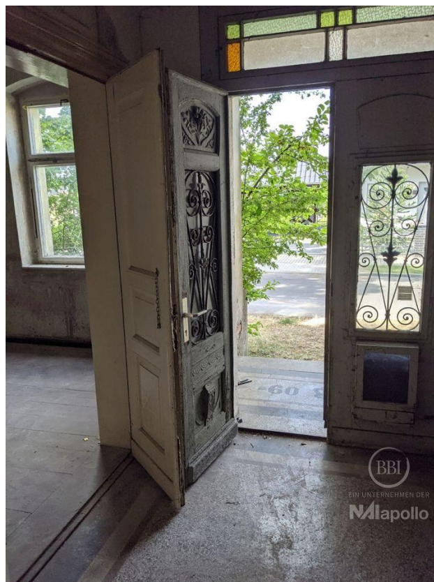
innen - vor Sanierung (2)