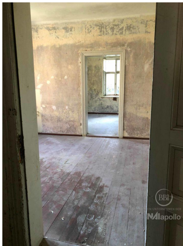
akt Bautenstand (3)