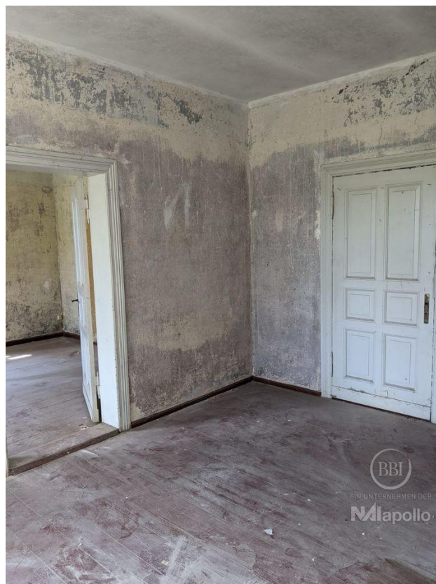
innen - vor Sanierung (3)