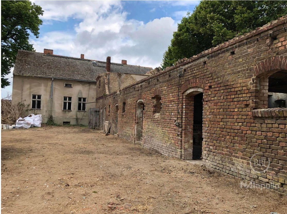
akt Bautenstand (1)