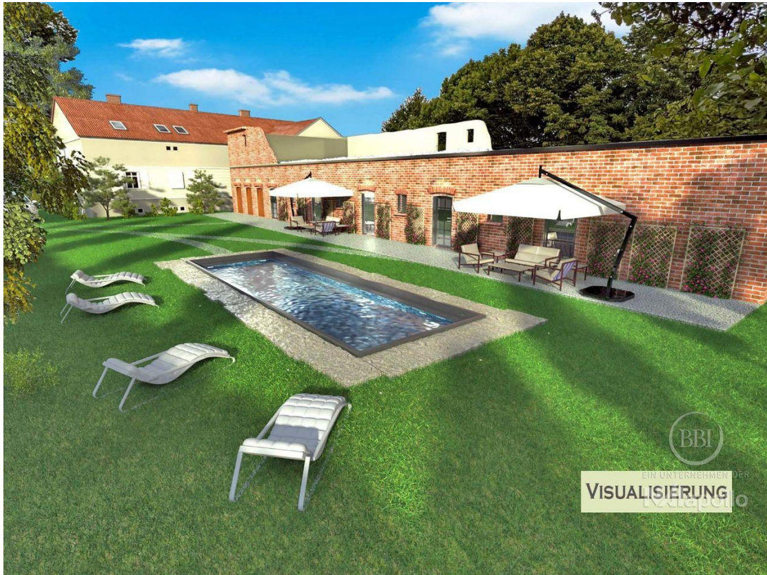
Visualisierung ohne Aufbau(5)_