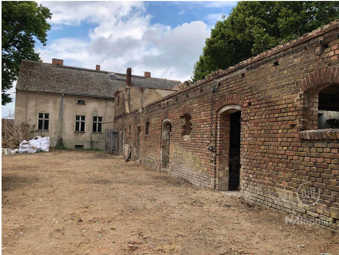
akt Bautenstand (1)