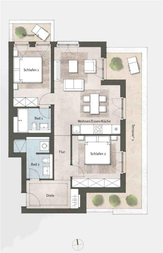
Haus 4, WE 54