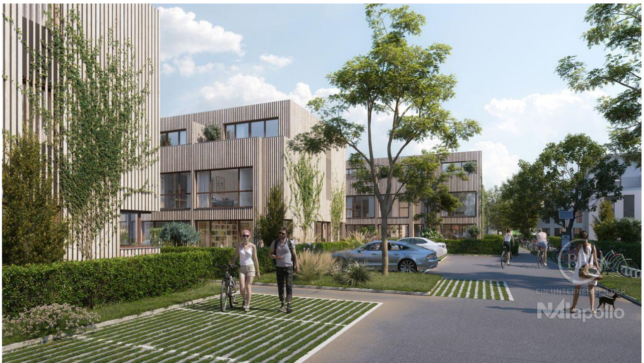
ANSICHT SO 1 FINAL