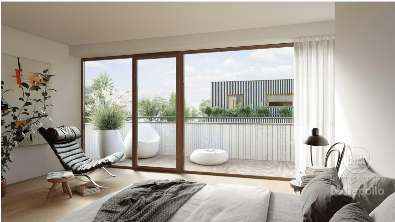
WOHNEN III FINAL