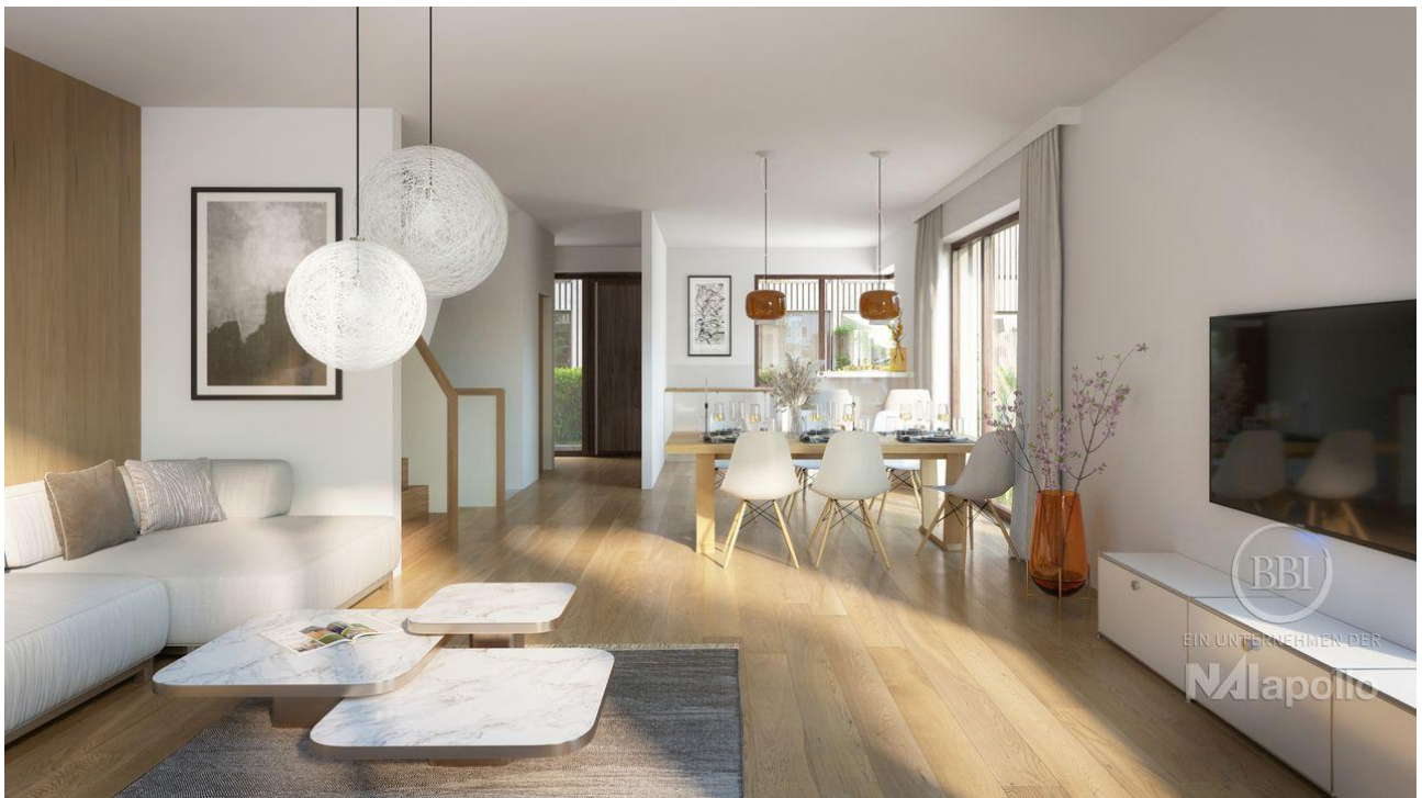
WOHNEN I FINAL