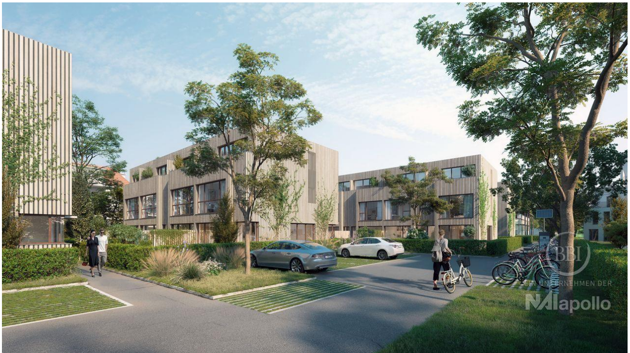
ANSICHT SO 2 FINAL