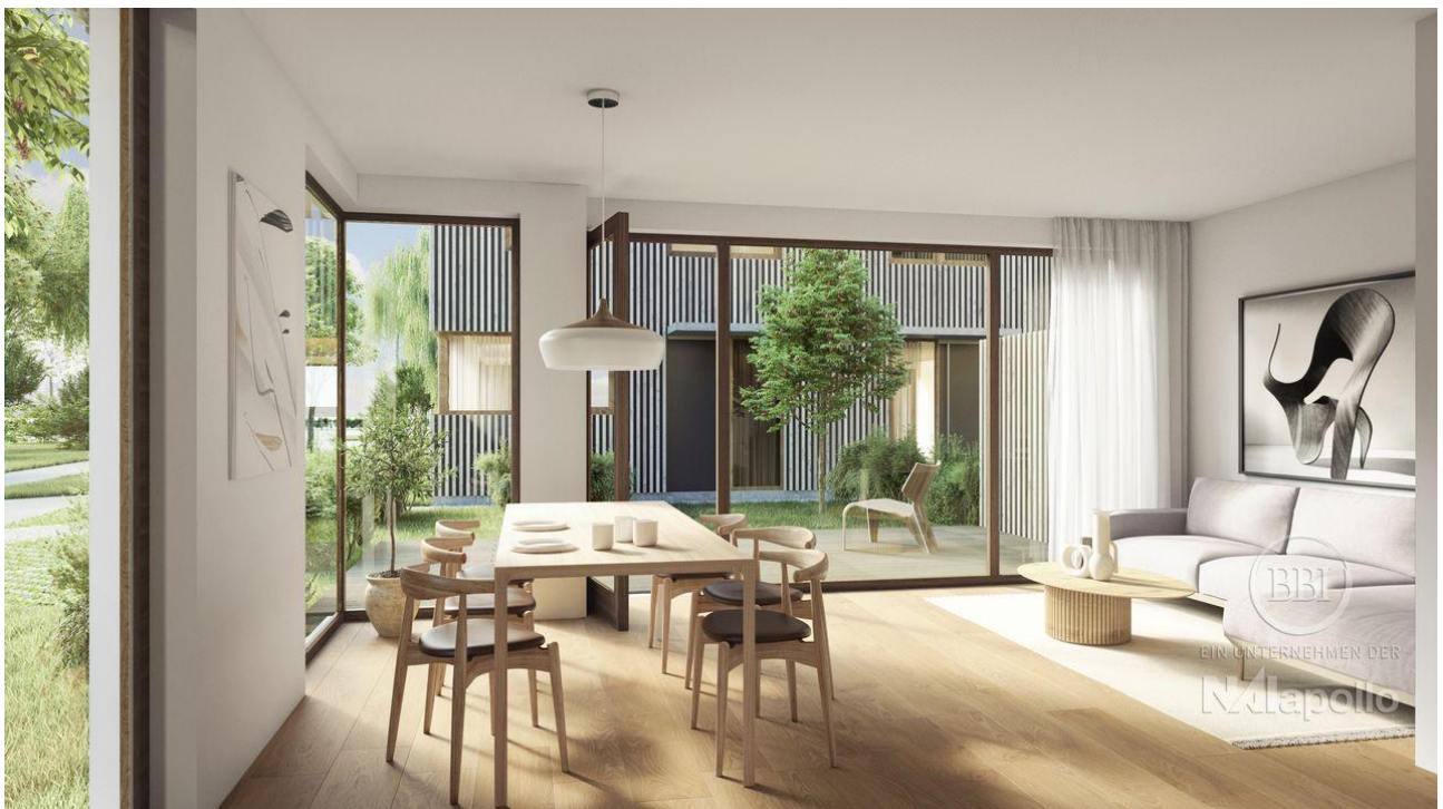
WOHNEN II FINAL