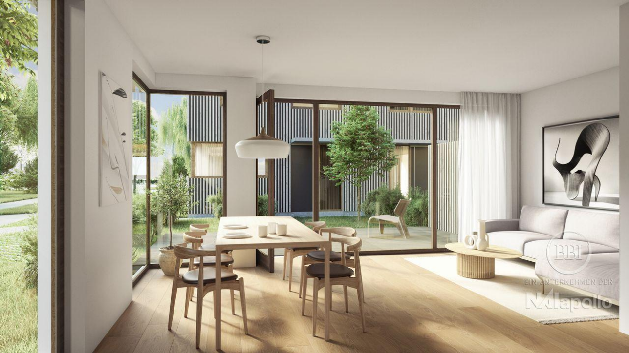
WOHNEN II FINAL