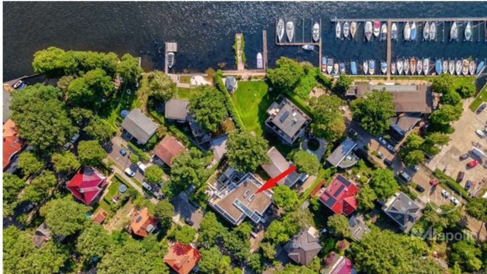
Luftbild Drone (4)_Titel