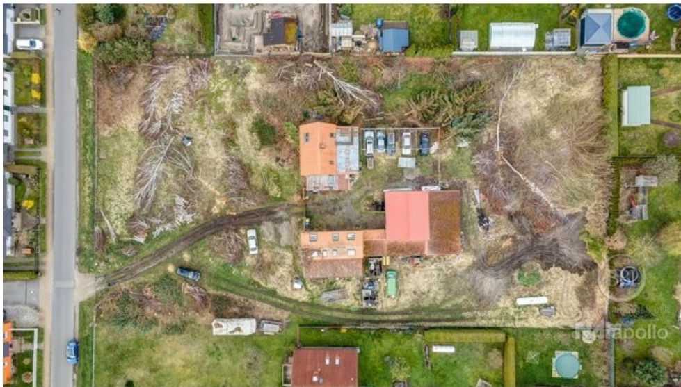
drone - 001