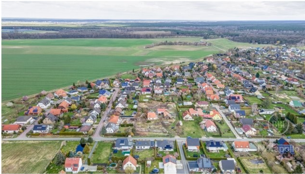
drone - 005