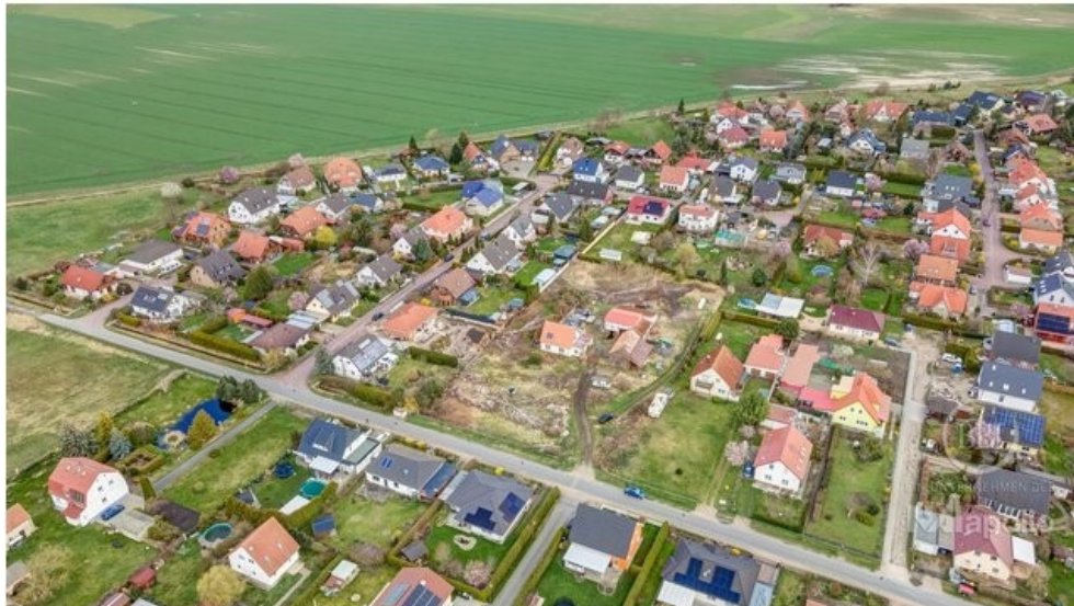
drone - 003