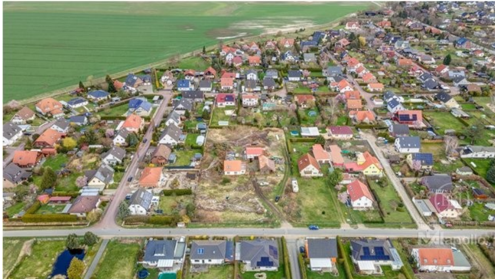
Luftbild drone - 002