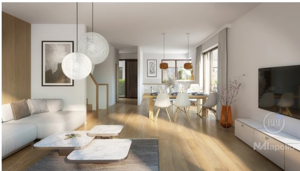
WOHNEN I FINAL