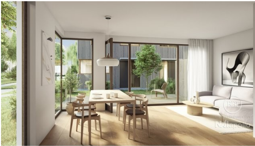
WOHNEN II FINAL