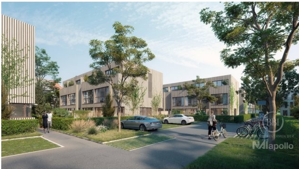
ANSICHT SO 2 FINAL