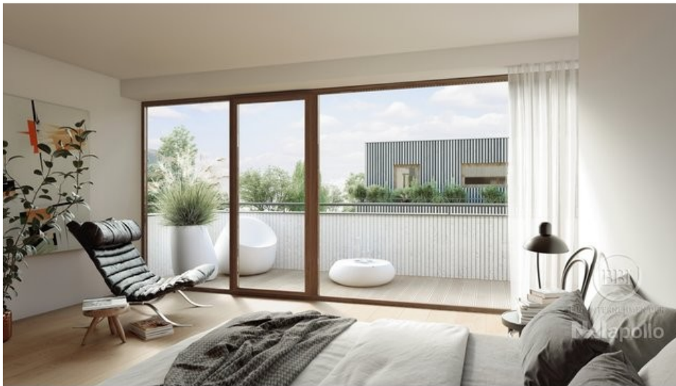
WOHNEN III FINAL