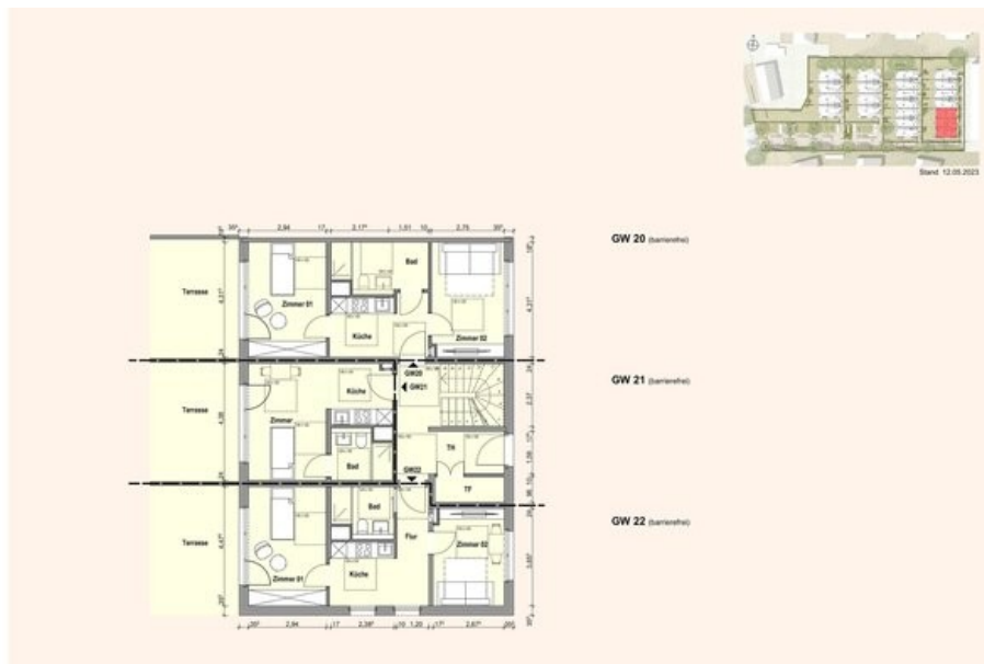
GRUNDRISS GE 20-22