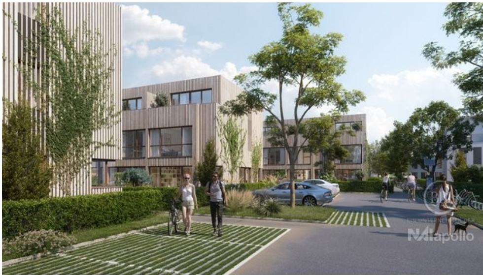
ANSICHT SO 1 FINAL