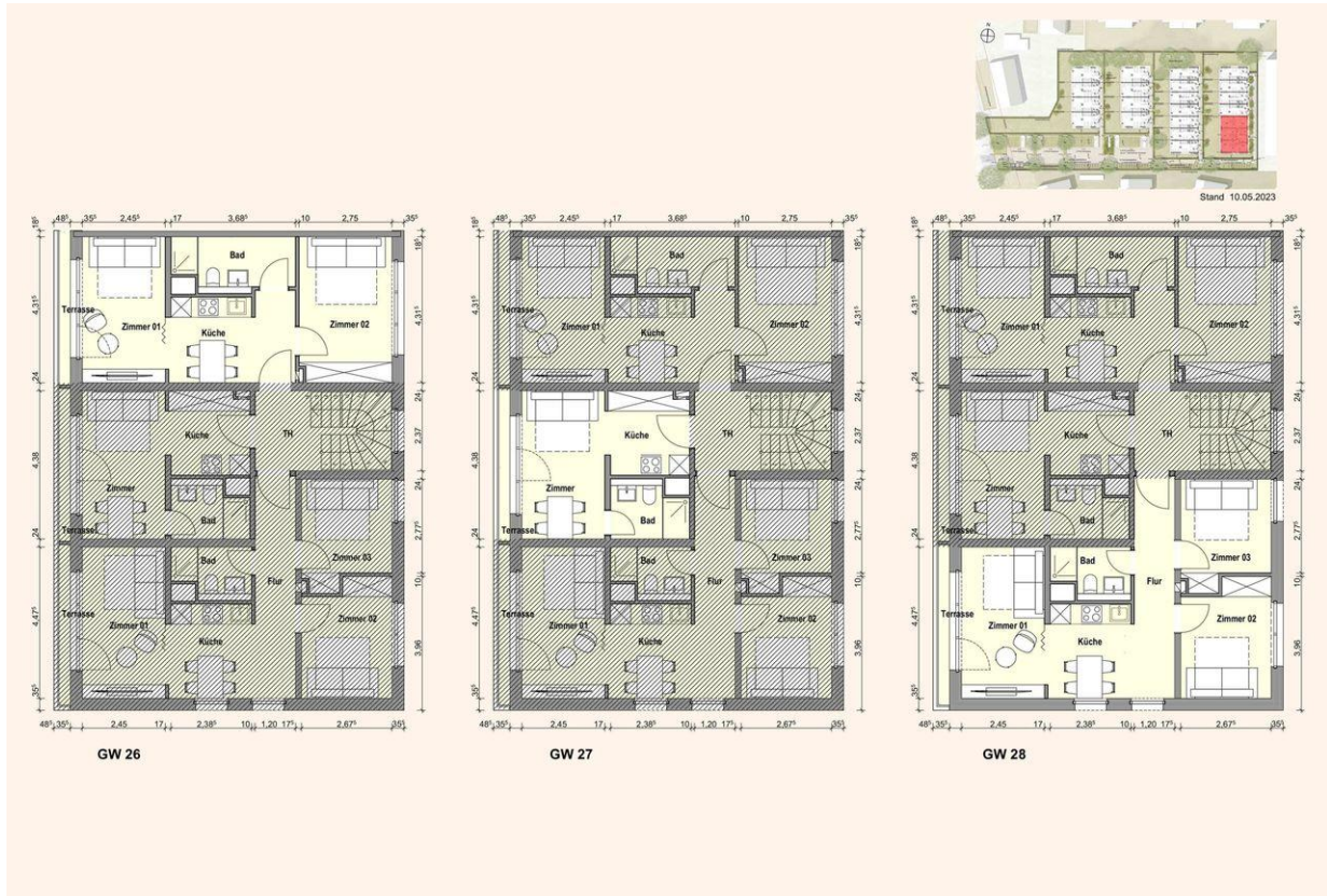
GRUNDRISSE GE 26-28