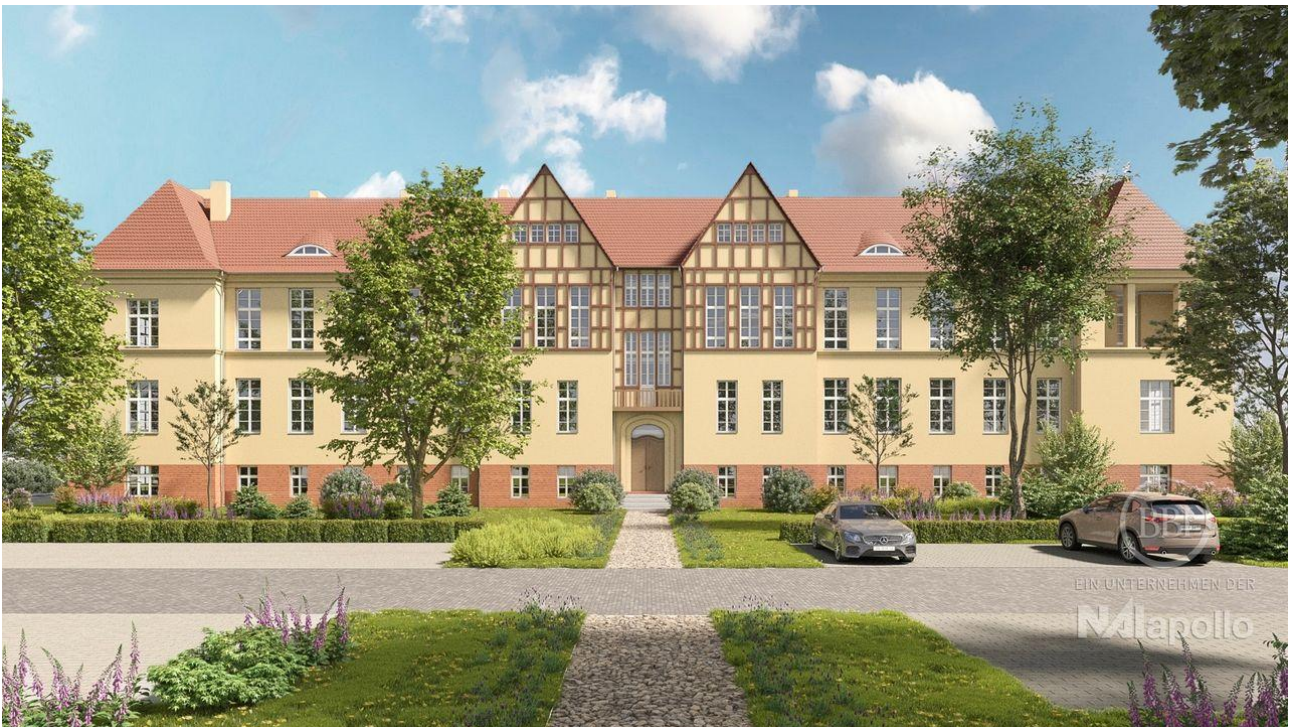
Wünsdorf Beispiel Visualisierung (5)