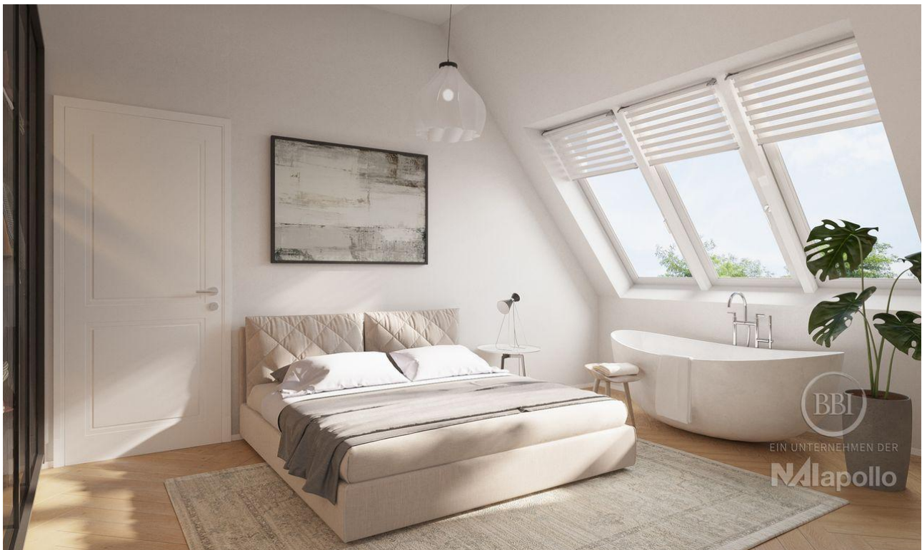
Wünsdorf Beispiel Visualisierung (6)