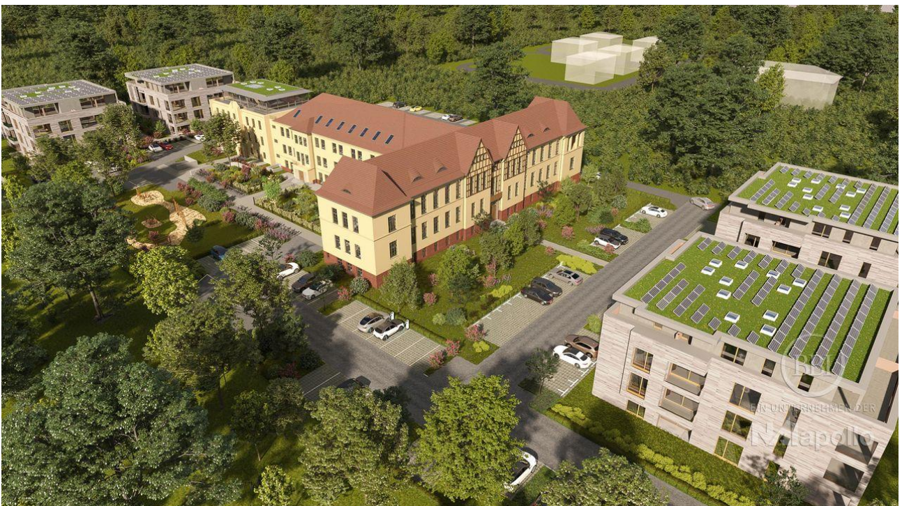
Wünsdorf Beispiel Visualisierung (2)