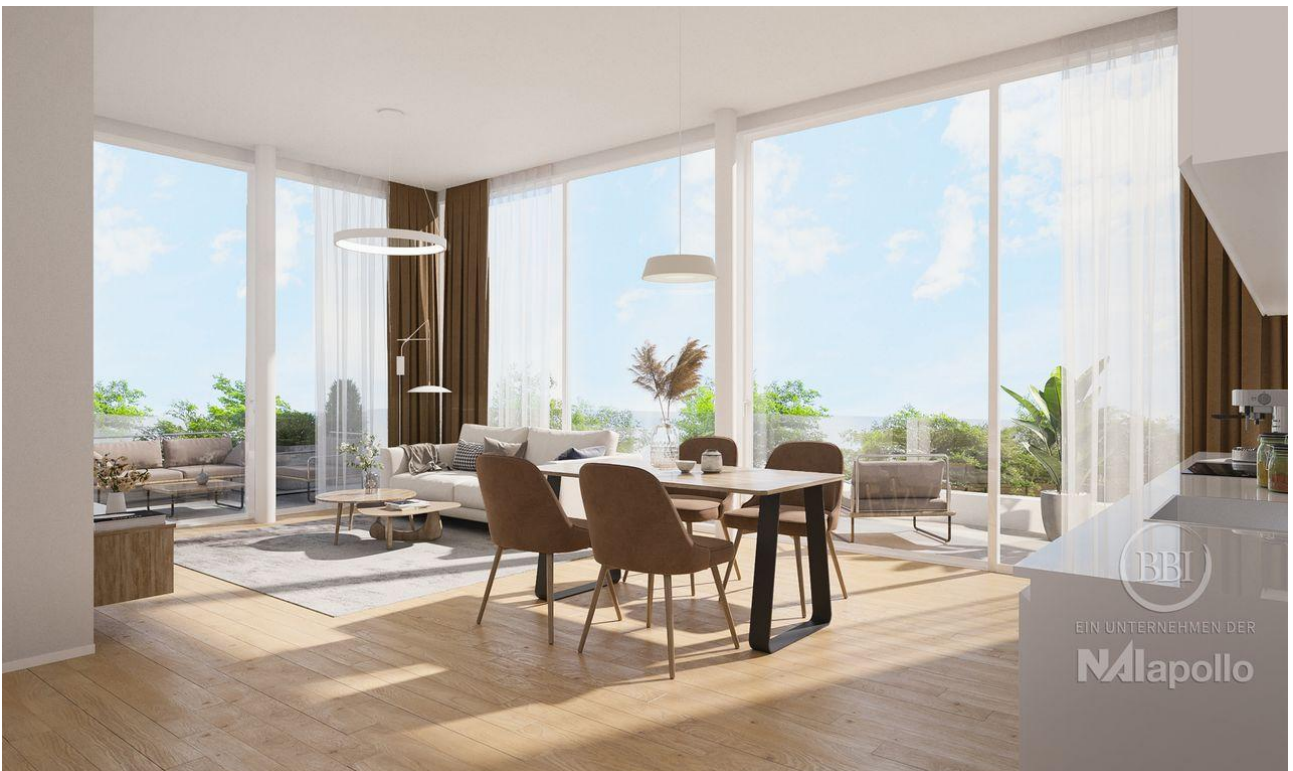
Wünsdorf Beispiel Visualisierung (3)