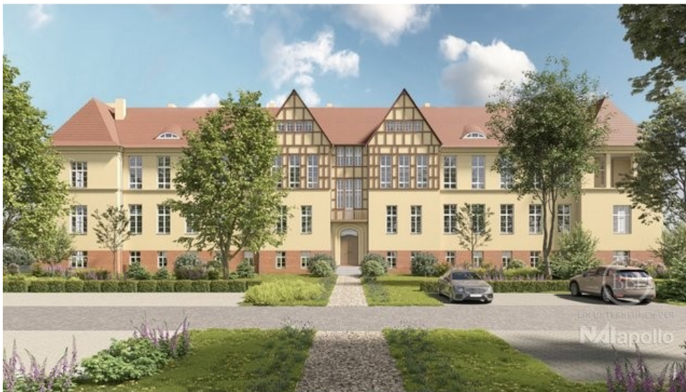
Wünsdorf Beispiel Visualisierung (5)