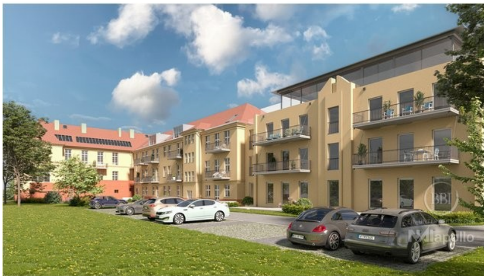
Wünsdorf Beispiel Visualisierung (1)