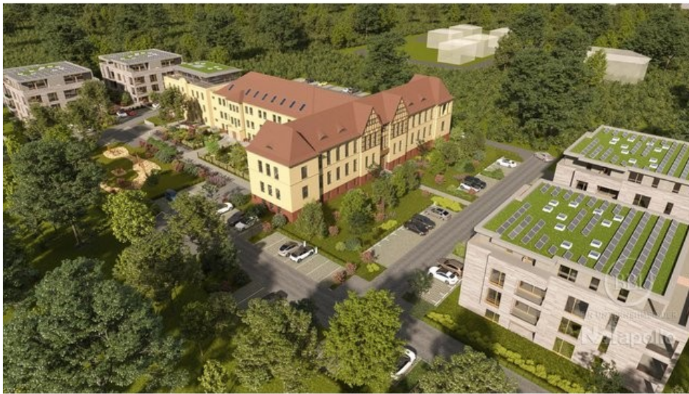
Wünsdorf Beispiel Visualisierung (2)