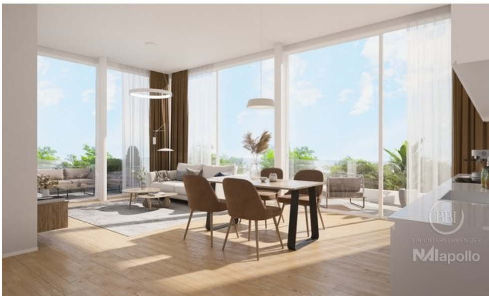
Wünsdorf Beispiel Visualisierung (3)