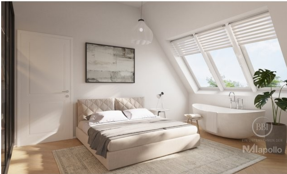
Wünsdorf Beispiel Visualisierung (6)