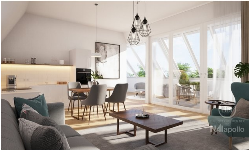
Wünsdorf Beispiel Visualisierung (4)