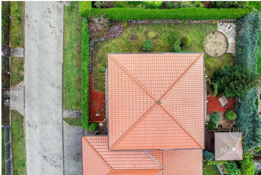
Ansicht Drone (2)