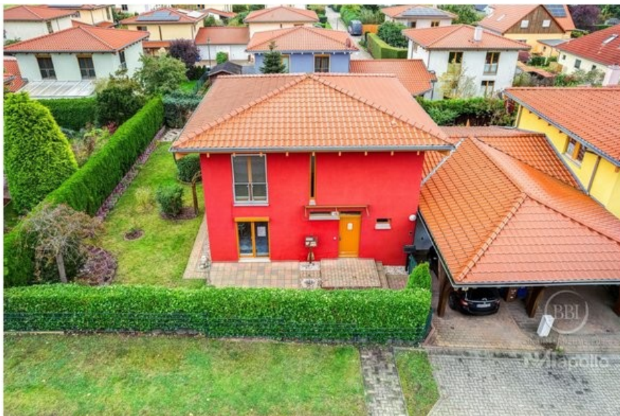
Ansicht Drone (3)