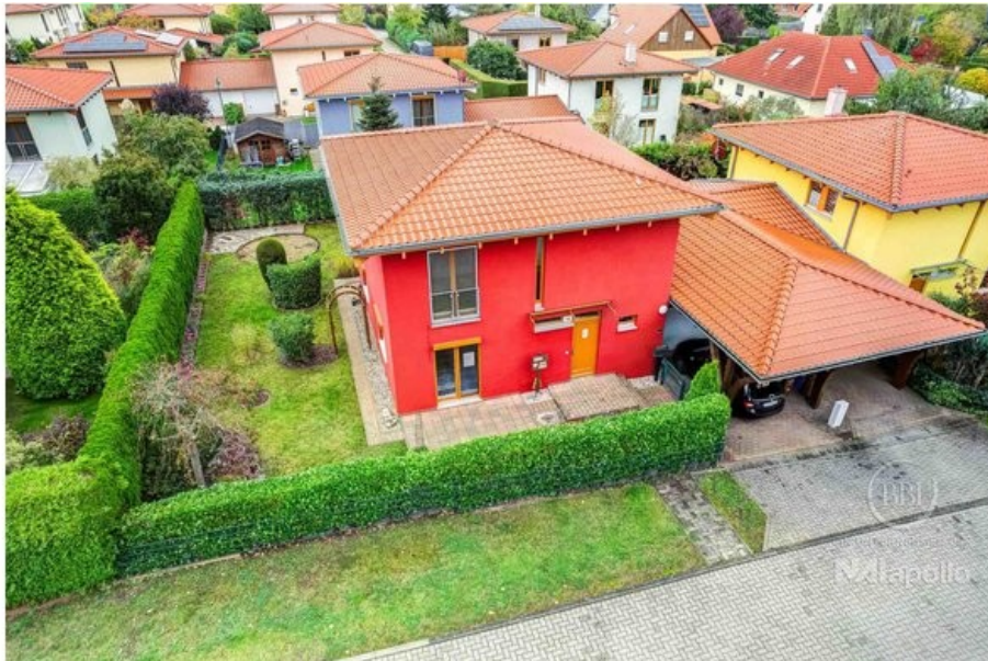
Ansicht Drone (1)