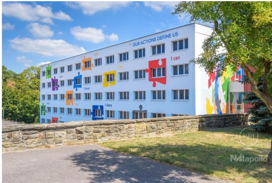
BB International School