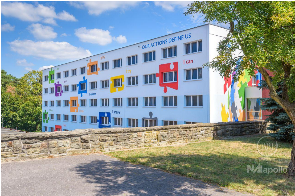
BB International School