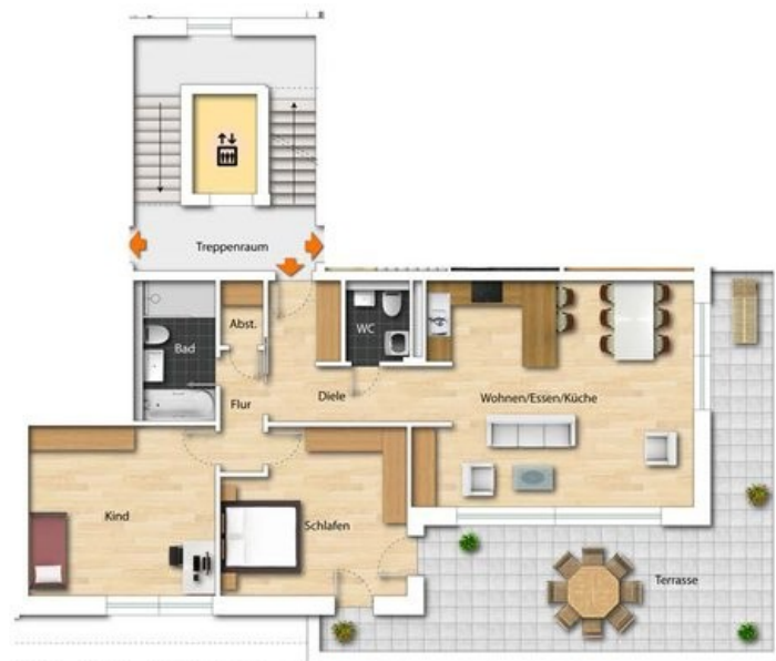
WE 32, 2. OG