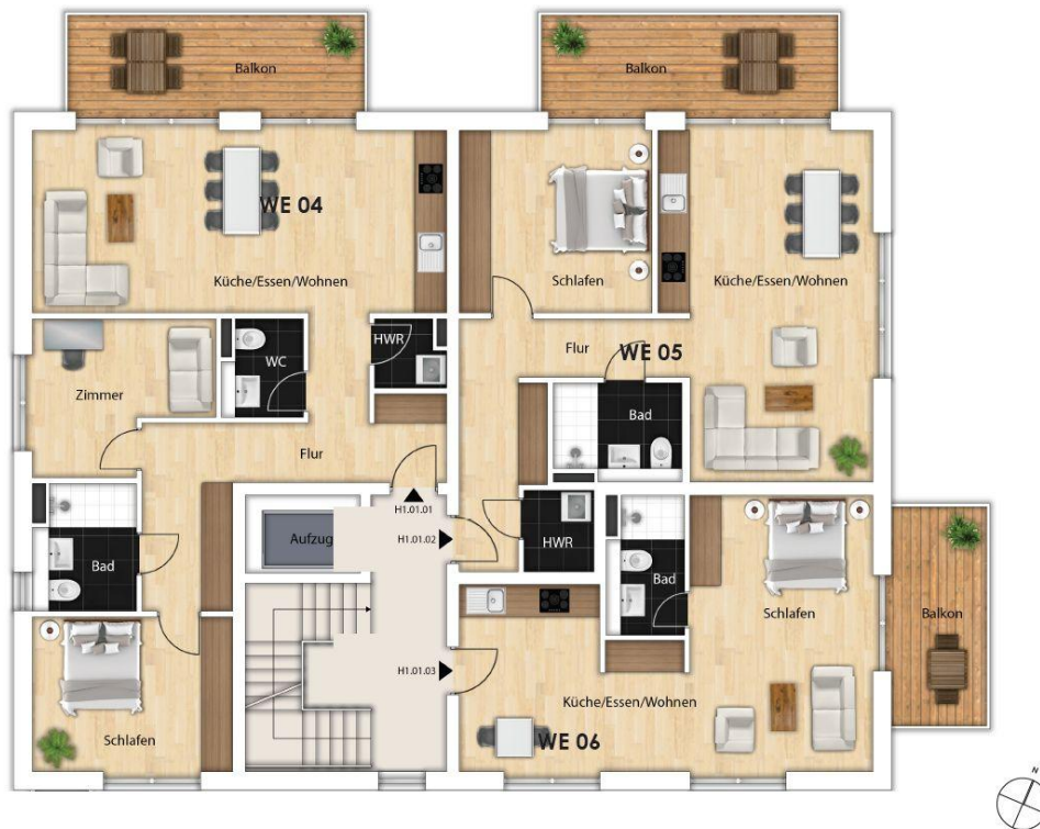
1. Obergeschoss Geschoßplan 1. OG