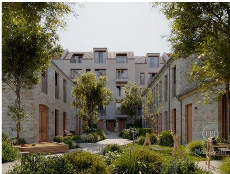
Hofbereich + Außenansicht