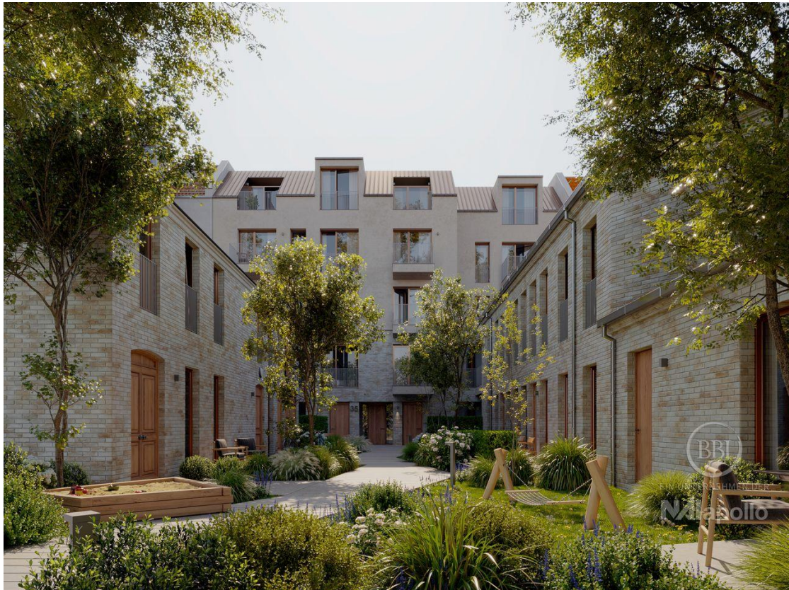
Hofbereich + Außenansicht