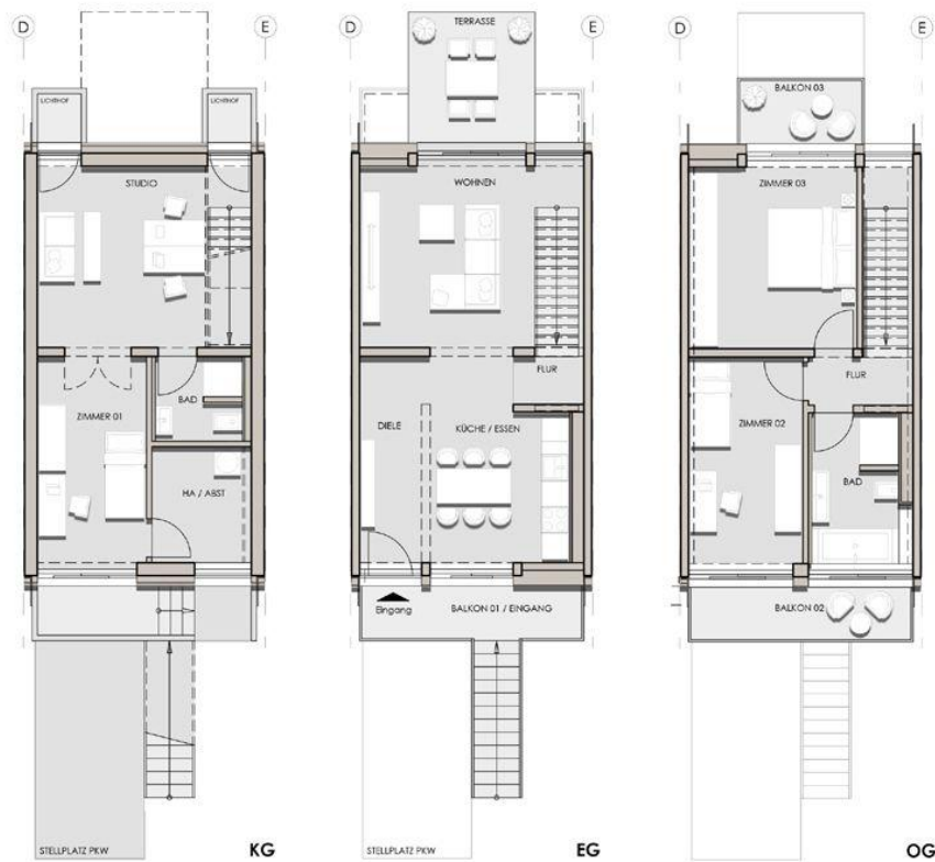
Reihenhaus mit 3 Ebenen