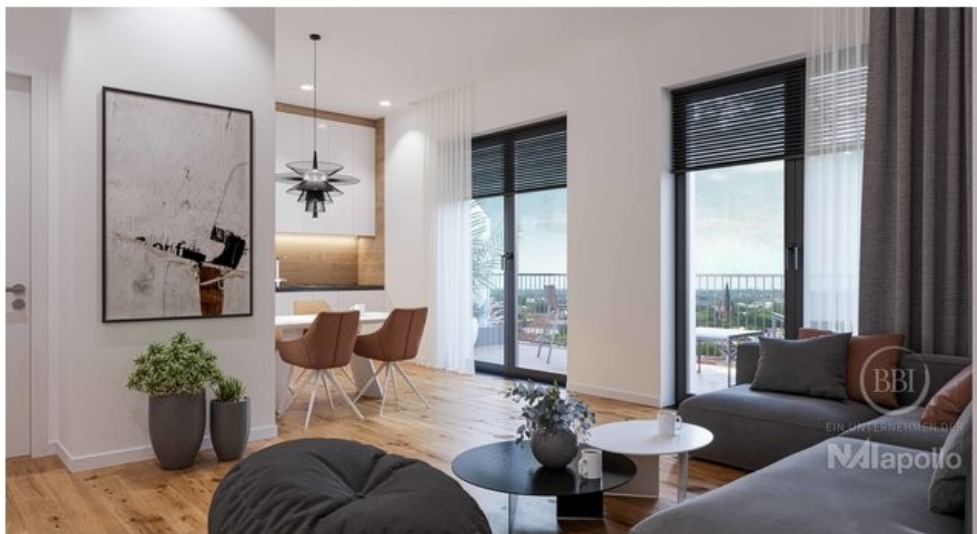
Ausstattung Visualisierung (3)