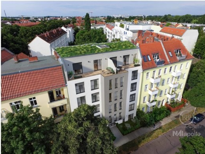
Ansicht Visualisierung (3)