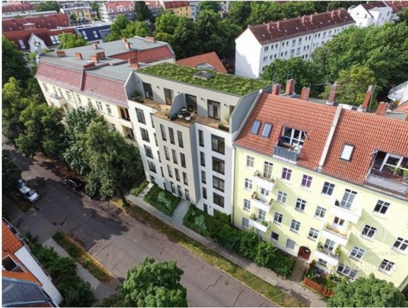
Ansicht Visualisierung (2)