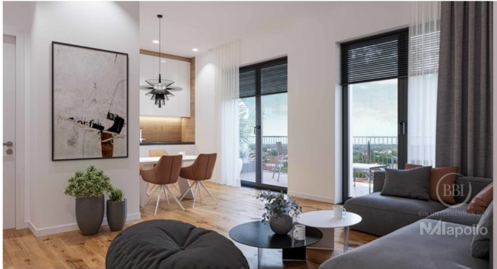
Ausstattung Visualisierung (3)