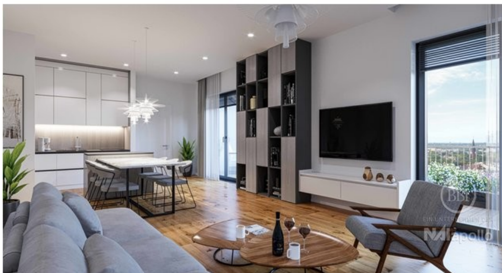
Ausstattung Visualisierung (1)