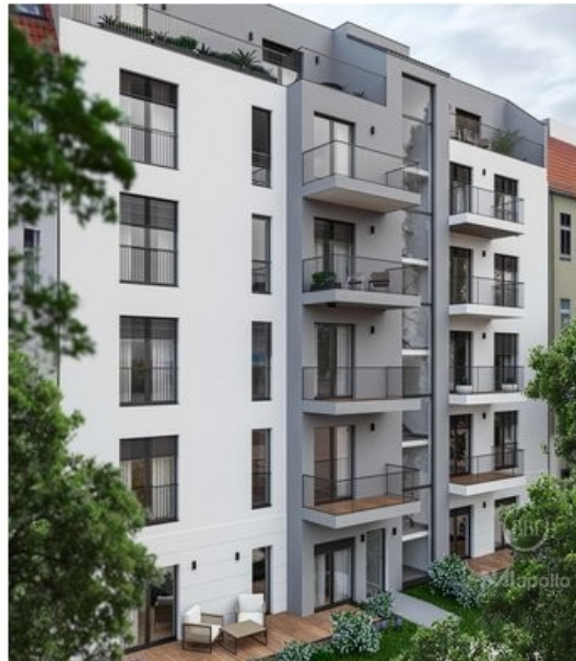
Ansicht Visualisierung (1)