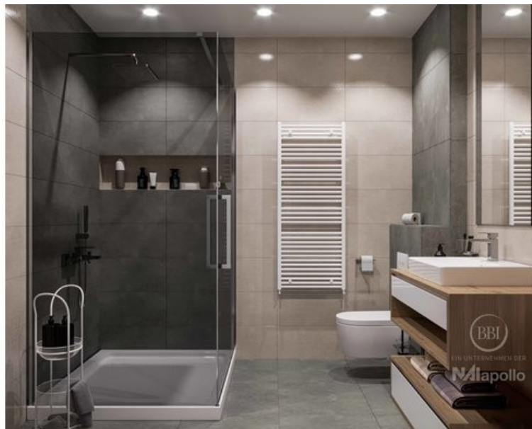
Ausstattung Visualisierung (2)