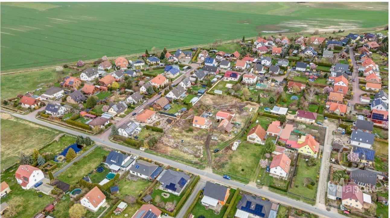
drone - 003