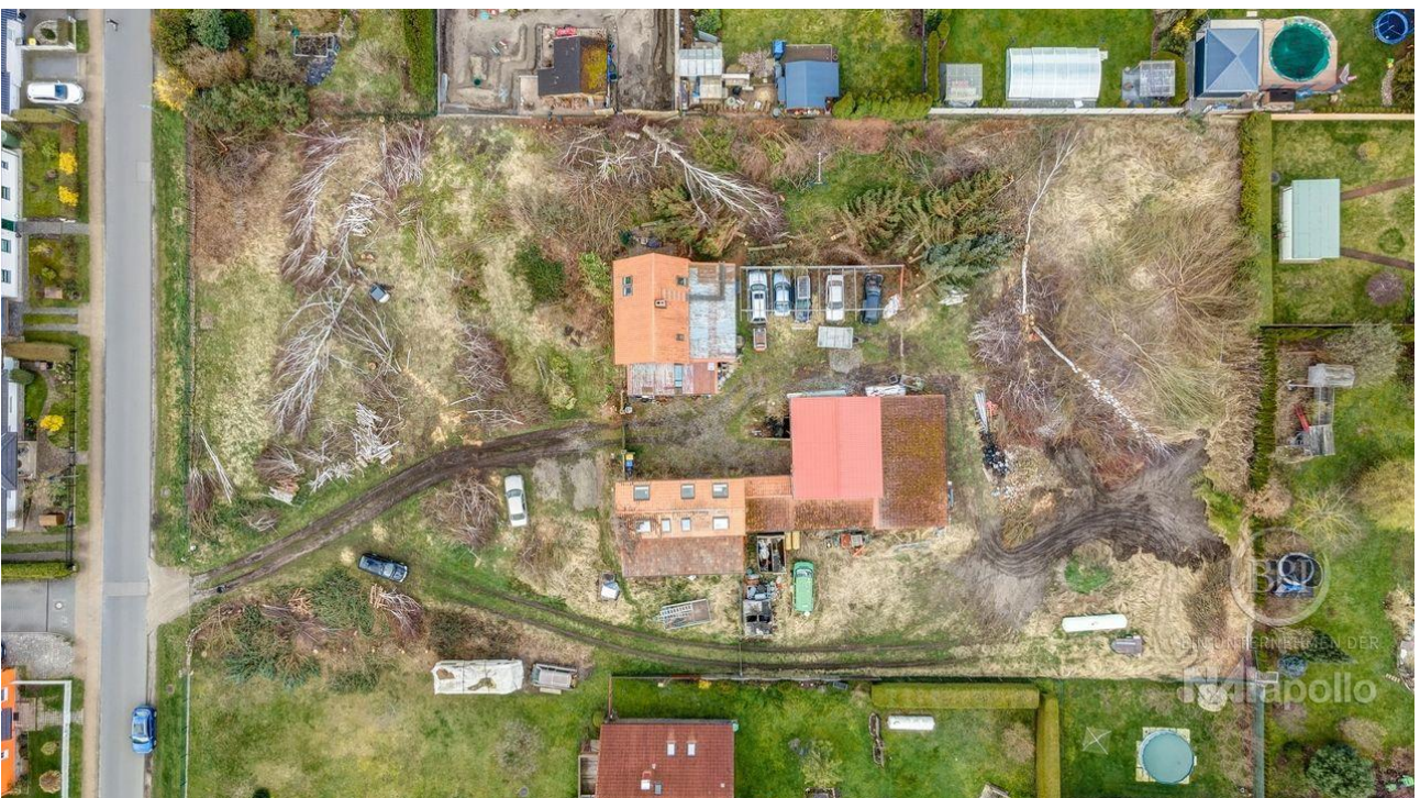
drone - 001