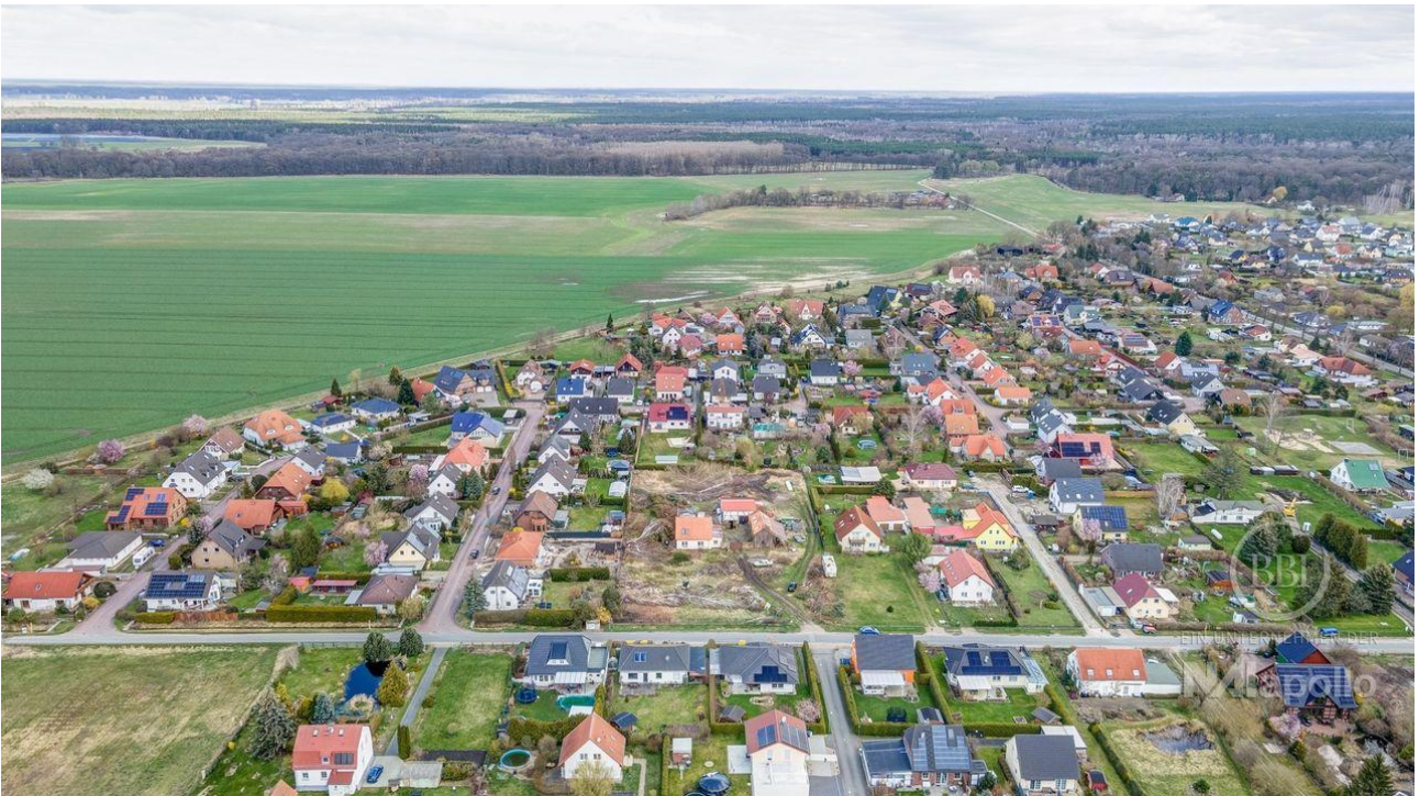
drone - 005