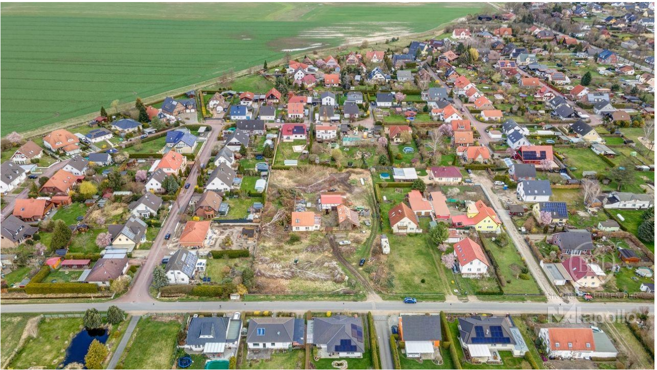
Luftbild drone - 002